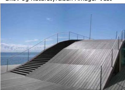
Det Maritime Ungdomshus, Sundby

CC Design A/S kan tilbyde broer på fleksible aluminiumsben. Som f.eks. Her som gangbro til fugleskul ved Skov og Naturstyrelsens område på Amager Vest. Grundet denne fleksibilitet kan man benytte brosystemet på mange spændende måder.