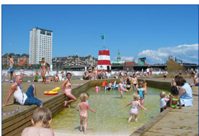
Havnebadet Islands Brygge

CC Design A/S har stor erfaring med at arbejde med hårdtræ, derfor kan vi tilbyde brolægning eller lignende, til fordelagtige priser, uden at gå på kompromis med kvaliteten.