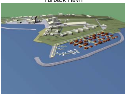
Udkast til Fakse Ladeplads Husbåde Havn

Vi kan tilbyde rammning af pæle i alle størrelser. Om det er forankringspæle, fortøjningspæle eller andet, kan vi være behjælpelige.