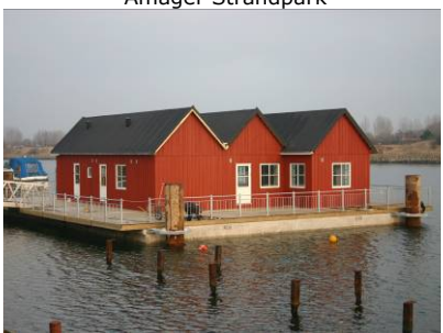
Klubhus, Bådklubben Valby

CC Design A/S tænker i helheder og ønsker at kunne tilbyde vores kunder løsninger med mange muligheder. Derfor er der ingen projekter der er for store eller for små for os. Udover nævnte, kan vi derfor også tilbyde udstyr til havne som belysning, forsyningssøjler, betalingssystemer samt livredningsudstyr.