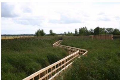
Skov og Naturstyrelsen Amager Vest